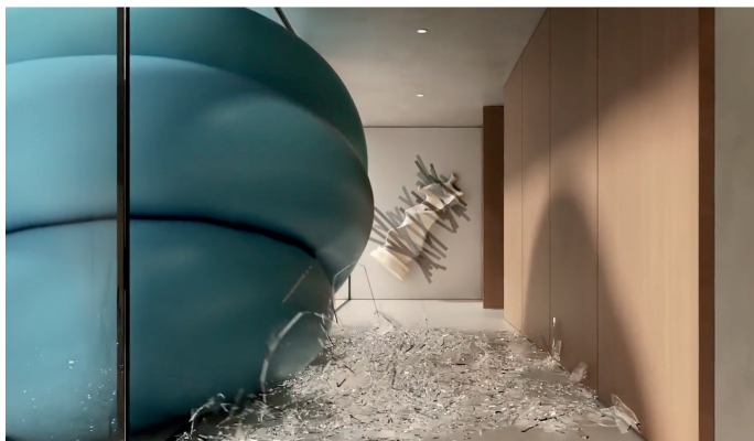
Digital Artwork

Una residenza di lusso, vuota e immacolata. Ogni oggetto e mobile di design occupa uno spazio preciso e calcolato. L'utilità non sembra avere importanza o avere luogo, la levigatezza e la perfezione della forma sono tutto. Tutto è calmo, perfetto, la luce abbraccia lo spazio e il suo bellissimo design. Ma ci sono altri oggetti che sfuggono a quello standard, che sono di tipo diverso. Oggetti che abitano ogni casa, puramente funzionali o che semplicemente stridono con la pretesa estetica dell'ambiente. Usati e messi da parte, nascosti, celati, camuffati, resi invisibili, come se fossero vergognosi. Questi sono quelli che irrompono nel paesaggio asettico e lo prendono d'assalto. Un colpo degno di una lotta di classe, dove un'utile minoranza si ribella alla pretesa e si accinge ad abbattere i propri simboli.