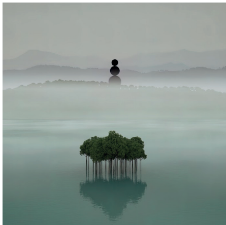
Digital Artwork Courtesy of the artist

Il pezzo “The Extraordinary” è unico nel suo genere, è arrivato dopo la mutazione dell’opera originale “The Ordinary”, uscita nel marzo 2022. Entrambi i pezzi sono un viaggio fotografico in cui il cerchio è sempre nella stessa posizione attraverso il tempo e le scene che passano. “The Ordinary” inizialmente aveva 250 edizioni e finora solo 14 collezionisti hanno soddisfatto i criteri e sono stati in grado di convertirsi da “The Ordinary” a “The Extraordinary”.