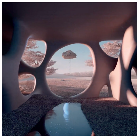
Digital Artwork Christie's New York City

Il visual esplora attraverso l'allegoria di un viaggio senza fine che si tuffa negli abissi per una costante ricerca dell'intangibile. Un processo in più fasi che ci permetterà di trovare ciò che stiamo cercando. Questa è Curiosity, da cui deriva il nome di questo pezzo. È il primo martello che rompe i muri di paradigmi e tabù permettendoci di andare oltre. L'infinita forza motrice che ci permette di evolvere, di scoprire, ma soprattutto di imparare.