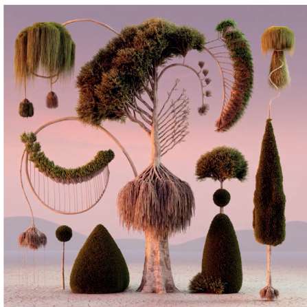
Digital Artwork Courtesy of the artist

La pazienza richiede tempo e la cura richiede amore. “Natural Balance” è una scultura digitale che incarna la mia interpretazione dell’equilibrio e dell’armonia nella natura. La natura è la mia principale fonte di ispirazione, in tutti i campi possibili. Utilizzando strumenti digitali, ho creato una serie di alberi ornamentali che trascendono i limiti del mondo fisico, rappresentando la serenità e la tranquillità che si trovano in natura. La scultura cattura anche l’essenza dei sentimenti di calma, perseveranza e pazienza che provo quando creo questo lavoro. Come spettatore, vorrei che tu sperimentassi la bellezza dei mondi digitale e naturale e l’armonia che si può ottenere combinandoli. Questo lavoro è una rappresentazione della mia incessante ricerca personale di equilibrio e bellezza di fronte a tutte le variabili incontrollate che la vita ci presenta.