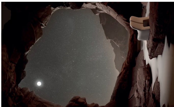
Digital Artwork Courtesy of the artist

“You guide me” fa parte delle tre visual denominate “The encounter” che raccontano alcuni sentimenti. Si tratta del valzer, rappresentato da oggetti che si incontrano in contesti diversi. È una danza nel silenzio.