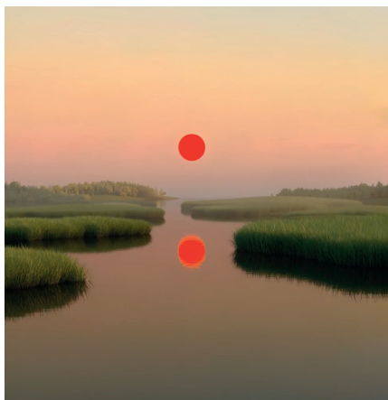
Digital Artwork

Una macchia rossa nel paesaggio che mi indica dove andare.